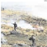
► Crecen protestas en zonas mineras.

El número de conflictos sociales en el país sigue creciendo mes a mes, situación que debe llamar la atención de las autoridades. El último reporte de la Defensoría del Pueblo, al 31 de julio, registra 147 controversias en 23