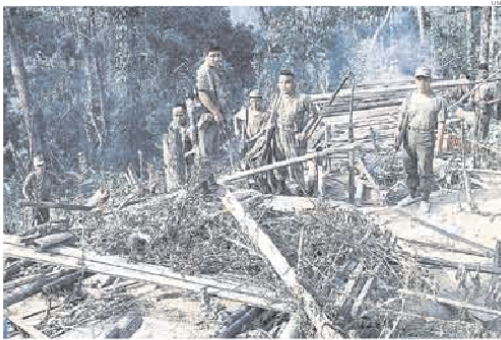
► RECLAMO. General Donayre recalcó a los fallecidos y discapacitados de las FF.AA. que dejó el terrorismo.

El ministro de Defensa, Aníbal Flores Ávalos, reñido, por su parte, que “no se puede poner el Estado de rodillas frente al terrorismo ofreciendo disculpas” y que, si no se entiende que el Estado es el que debe decidir qué es lo que se hace con las recomendaciones de la CVR, “estamos regresando a los 80”. En todos los tomos, el titular del sector se negó a aceptar la afirmación de que hubo políticas de Estado para la