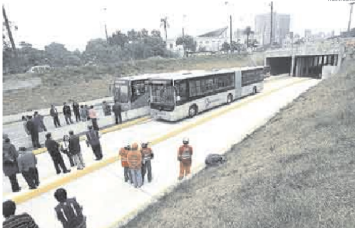
DUDAS RODANDO. Ex funcionario edil aparece vinculado a uno de los consorcios que operará buses.

► Empresa familiar integró consorcio Perú Masivo, uno de los postores elegidos.