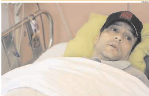
▷ DA LA PELEA. El popular 'gordo' conversó con Perú. 21 desde su lecho en el Instituto de Enfermedades Neoplásicas.