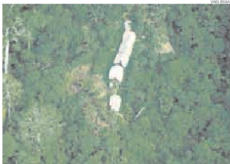
► VULNERABLES. Actividad petrolera afecta la salud de los pueblos aislados.

► Invocan al Gobierno que implemente legislación específica para proteger a los indígenas.