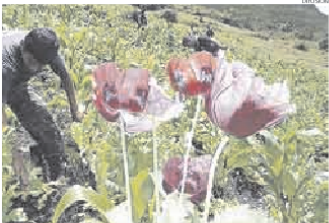
▶ AMAPOLA. La mayoría de sembríos de la planta se ubica en el nororiente.

▶ Detectan que clanes familiares sacan sembríos en vehículos de carga hacia Ecuador.