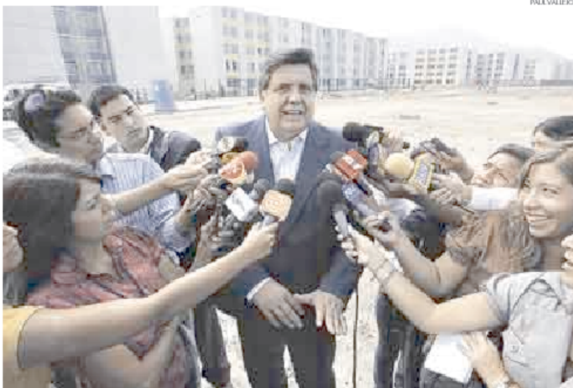
► PIENSA EN 2011. Presidente García también aportó con sus declaraciones al adelantado carnaval electoral.

APUESTAN POR LOS FRENTE. Lo curioso es que no solo Alan García destacó la idea de formar un frente que garantice un gobierno de unión nacional, con el 90 por ciento de todas las fuerzas políticas, tomando como referencia la propuesta de Simon de que