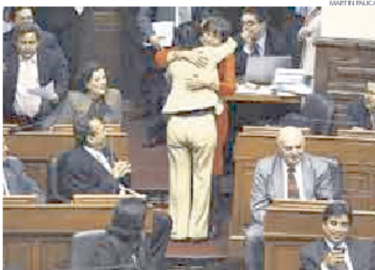
► MÁS OTORONGOS. Desde el próximo quinquenio habría más inquilinos.

CAMBIOS EN BCR. En jornada matinal, en tanto, el Apra, UN, Grupo Fujimorista y UPP sacaron adelante —con 83 votos