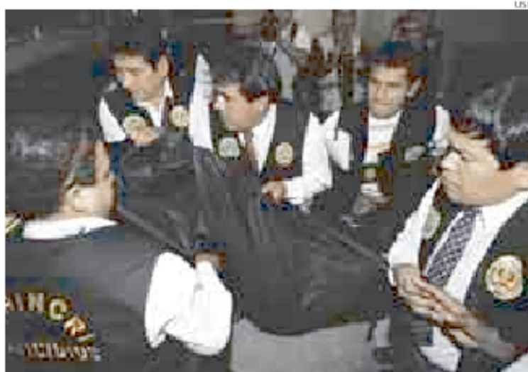
► INDICIOS. La Policía sigue nuevas pistas para hallar al asesino de la cantante.

de que el hombre también haya sido asesinado. Ayer se determinó que el semen encontrado en el cuerpo de Delgado habría sido producto de una relación sexual consentida y no de una violación.