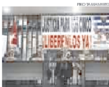
> Borge no criticó golpe en Venezuela.

Embajadores de los países integrantes de la Alianza Bolivariana para los Pueblos de América (ALBA) rechazaron ayer el golpe de Estado que depuso al presidente de Honduras, Manuel Zelaya. El embajador de Nicaragua, Tomás Borge, advirtió que si se consolidara el acto del bando golpista, "ningún país de Latinoamérica estará seguro".