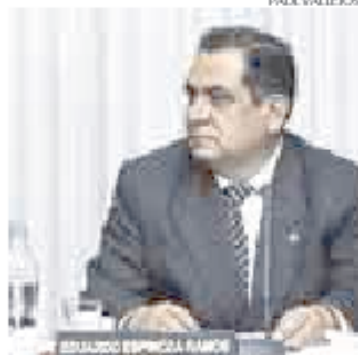
> Espinoza indagará uso de fondos.

se ha dedicado a decir que todo anda bien en los programas cuando, en realidad, no es así. No hay una verdadera reducción de los índices de pobreza, y eso se refleja en los continuos reclamos de la población por falta de atención del Estado", opinó el congresista.