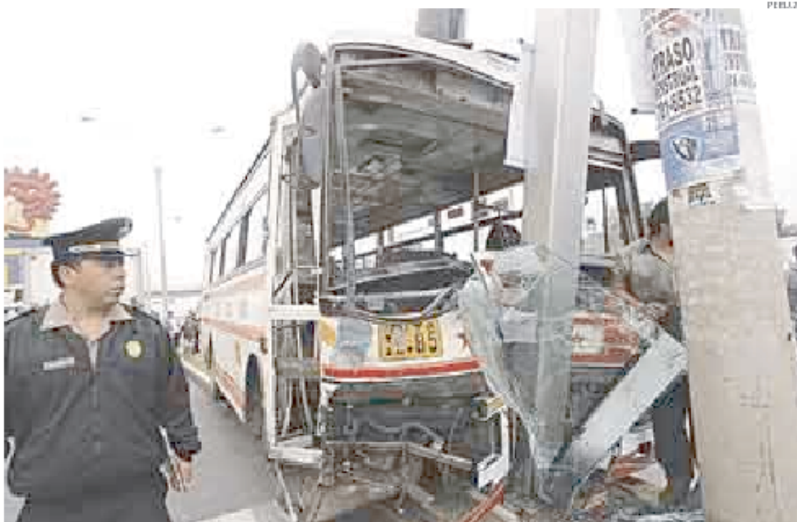
► NO MÁS ACCIDENTES. Víctimas solicitan cumplimiento estricto de norma para evitar más muertes en las pistas.

Ante el anunciado paro de transportistas, para este martes 21, dicha organización ha exhortado al MTC a que no dé marcha atrás y haga cumplir la norma con firmeza.