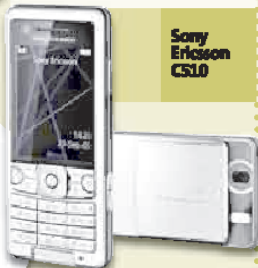
Sony Ericsson CS10

Este equipo graba videos y permite la subida y descarga de estos directamente de tu cuenta en YouTube. Con esta característica, los aficionados a esta portal web podrán sacar mucho provecho. Me gustó mucho la integración que tiene el celular con Facebook y con otros medios de publicación on-line.