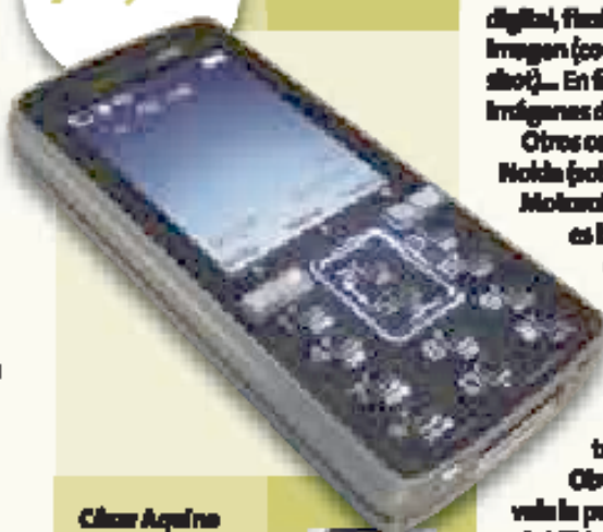
Sony Ericsson K850i