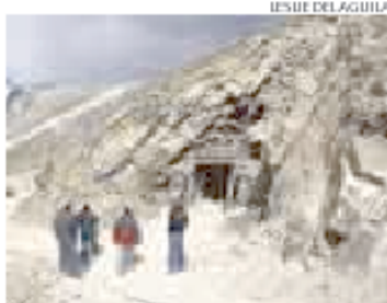
► Minería afecta zona protegida.