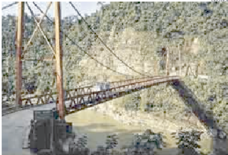
► INAMBARI. Autoridades temen que el proyecto afecte vida de pobladores.

Sin embargo, la Dirección Regional de Educación señaló que el consorcio que trabaja en la hidroeléctrica no ha aclarado cómo se efectuará el traslado de los asentamientos humanos ubicados en el área del proyecto, ni cómo se