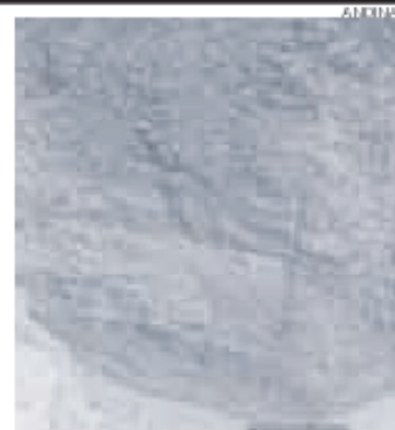
> Geoglifo está en el cerro Campana.

tros de alto y 1.30 metros de ancho, según los arqueólogos, habría tenido un importante significado para los antiguos pobladores preíncas. Quiroz dijo que en la parte baja de la colina, donde está el geoglifo, hay restos arqueológicos de un centro ceremonial. Allí se pueden apreciar algunos muros, piezas de cerámica y restos óseos.