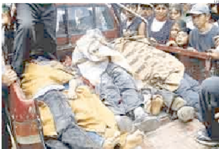
> MALA RACHA. Accidente en Sandia (Puno) dejó ocho escolares muertos.

► En otro accidente, en Arequipa, fallecieron siete personas y 30 quedaron heridas.