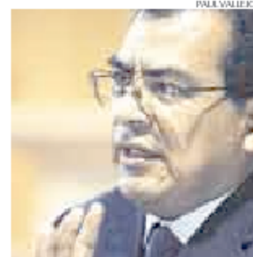
> No coincidió con titular de Defensa.

viendo qué país hace maniobras militares y cuál no, el Perú debería pensar en cómo organizar su defensa en base a realidades continentales que muestran —entre otras cosas— que, desde hace seis años, Venezuela ha iniciado una carrera armamentista.