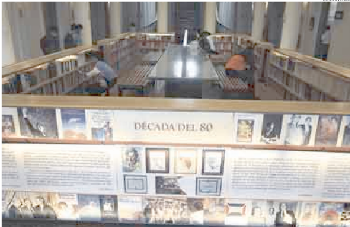
► RENOVADO Y VERSÁTIL. Ahora funcionan allí trece salas dedicadas a los narradores de toda la historia peruana.