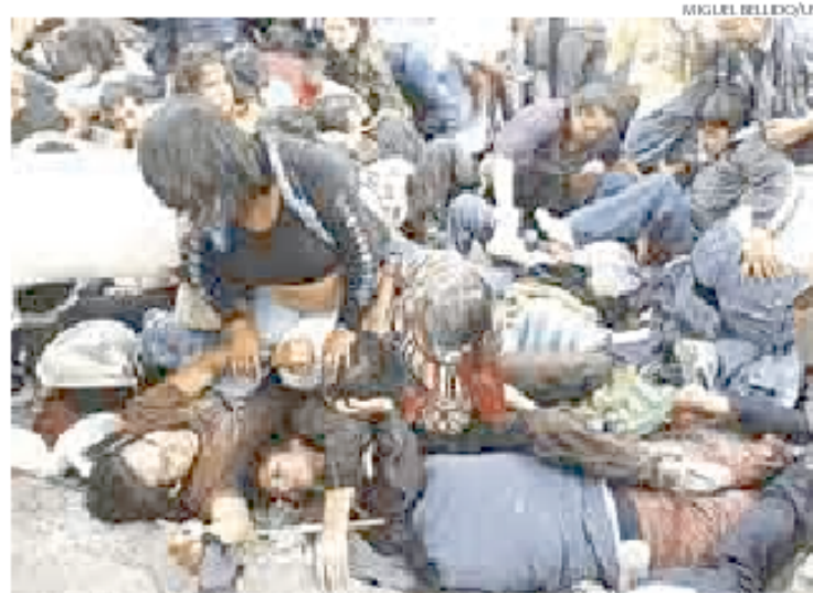
► CAOS. Pobladores se pisoteaban unos a otros para huir de la zona de conflicto.

Tras varios días de protestas, el jueves, el consejo regional se reunió en Curahuasi y acordó construir un hospital en Andahuaylas y distribuir el presupuesto equitativamente entre las demás provincias. En dicha sesión también se rechazó la vacancia de Salazar Morote y, aunque se pensó que con eso se acabarían las protestas, no fue así pues el Frente de Lucha de Abancay señaló que mantendría la huelga si no