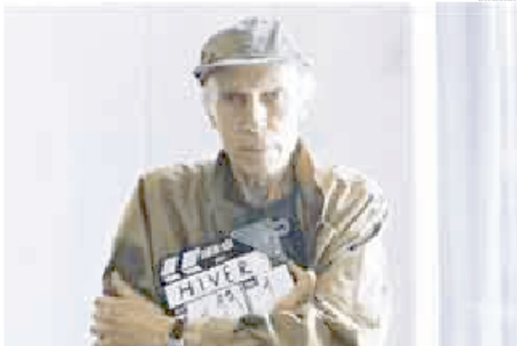
► PERSONAL. Solía trabajar entre los mismos actores y técnicos de sus filmes.

Él alguna vez comentó: "La imagen del cine es el presente, porque la cámara