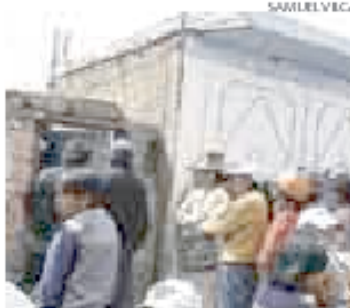
> Crimen ocurrió en Santa Lucía.

les A.R.C.H. (9) y el menor A.C.H. (6). La pequeña presenta signos de haber sido ultrajada violentamente, por lo que se presume que el asesino violó y mató a la menor y, luego, degolló a su hermanito para evitar que este revelara su identidad.