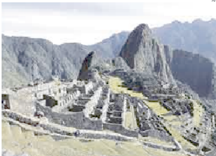
> SIN VISITAS. Ciudadela inca fue cerrada al turismo desde fines de enero.