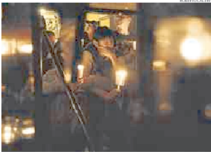
Decenas de limeños realizaron una vigilia durante La hora del planeta en la plaza de Armas, con una vela en la mano. El Palacio de Gobierno y la Municipalidad de Lima también participaron en el acto a oscuras.

La Hora del Planeta se cumplió en el Centro Histórico